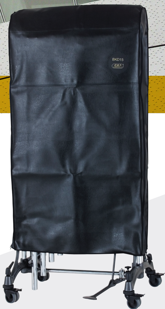
Cover for chimes Hülle für Röhrenglocken