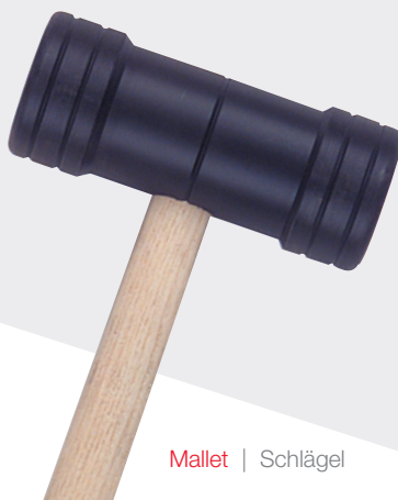
Mallet | Schlägel