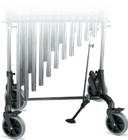
Field Frame Base Field Frame-Gestell für Röhrenglockenspiel