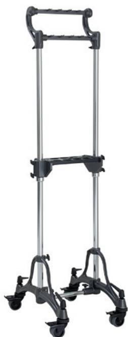
Rack für 7 Töne mit 38 mm Röhren 7 note chime rack for 1.5" tubes